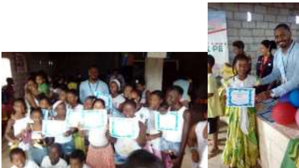
Esmeraldas, 22 de junio del 2017

La Prefectura de Esmeraldas, además tiene previsto realizar la Feria de Movilidad Humana donde los participantes de los diferentes talleres impartidos, exhibirán lo aprendido.